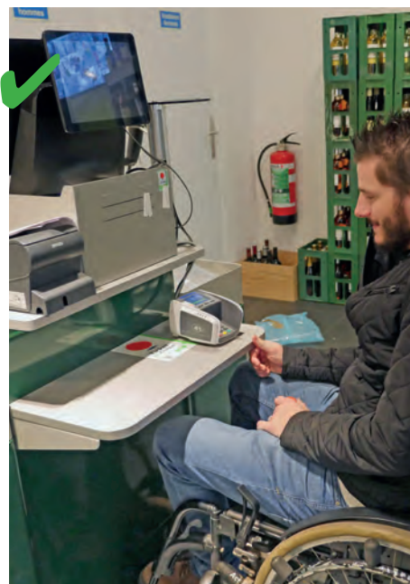
☺ Le comptoir comporte une partie abaissée à 80 cm du sol, ce qui permet à tout le monde d'effectuer une transaction sans tracas.