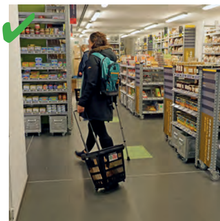
☺ Les allées sont suffisamment larges pour que les clients puissent se croiser. Ici une personne est équipée d'une béquille et d'un caddie mais peut tout de même circuler sans souci. De plus, il n'y a aucun obstacle au sol.