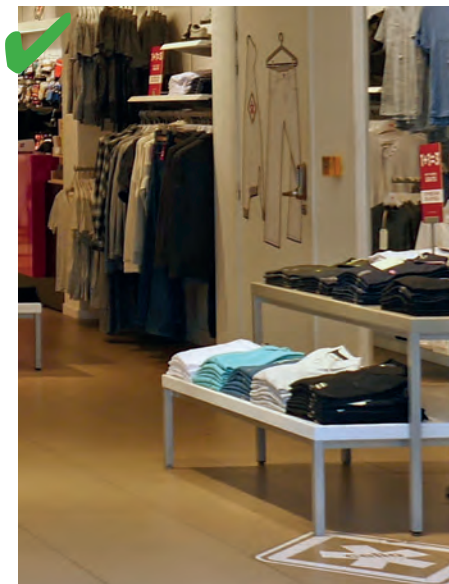
☺ Les présentoirs permettent d'attraper les produits entre 0,50 m et 1,30 m du sol.