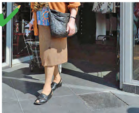
☺ Exemple d'une entrée de magasin plain-pied.