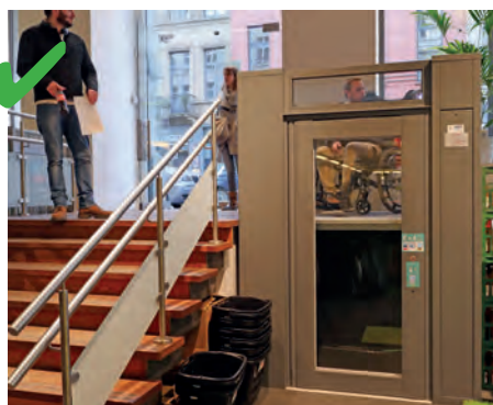
☺ Un monte-charge a été prévu, ce qui profite aux personnes avec un landau ou un fauteuil.