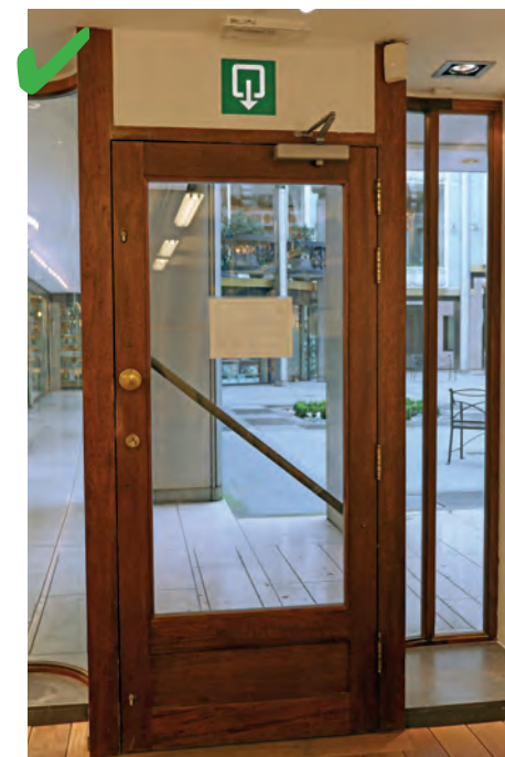
☺ Une issue de secours est prévue. La porte mesure 0,90 cm de large, ce qui permet à une personne en fauteuil d'évacuer.