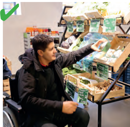
☺ Des présentoirs sont assez bas, les marchandises sont atteignables pour les personnes de petite taille et celles en fauteuil.